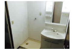
※図面と現況が異なる場合は現況を優先とします